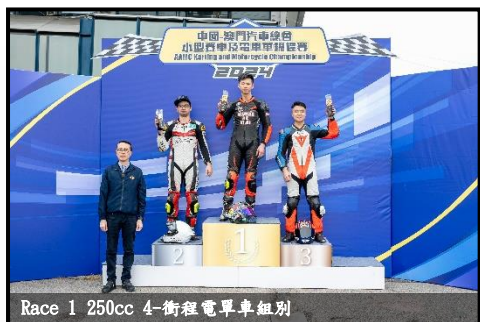
Race 1 250cc 4-衝程電單車組別