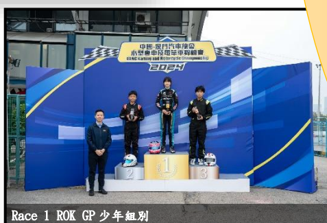
Race 1 ROK GP 少年組別