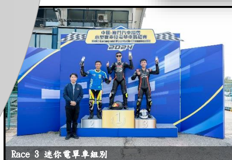
Race 3 迷你電單車組別