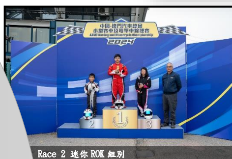
Race 2 迷你 ROK 組別