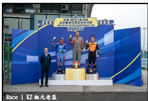
Race 1 KZ 組元老五