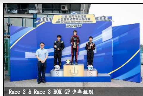
Race 2 & Race 3 ROK GP 少年組別