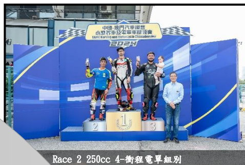
Race 2 250cc 4-衝程電單車組別