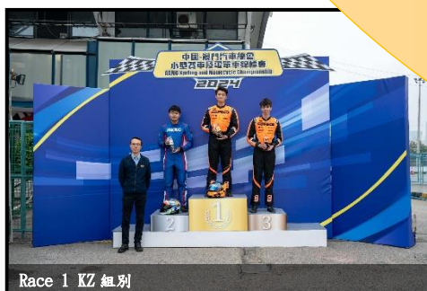
Race 1 KZ 組別

2024 年中國—澳門汽車總會計小型賽車及電單車錦標賽全年將進行每項八回合共十六場比賽，第一至三回合賽事已分別於 3 月 2-3 日、3 月 16-17 日及 4 月 13-14 日順行舉行。每場比賽的各組賽事亦於當日決出冠、亞、季軍。