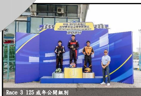
Race 3 125 成年公開組別