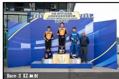
Race 2 KZ 組別