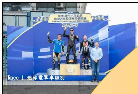
Race 1 迷你電單車組別