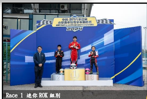
Race 1 迷你 ROK 組別