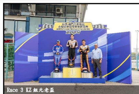
Race 3 KZ 組元老盃